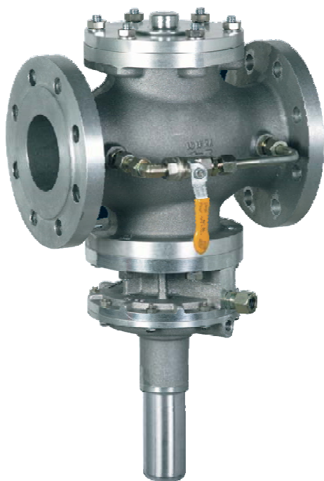
Предохранительно-запорный клапан S100

Предохранительно-запорный клапан тип S100 Предохранительно-запорный клапан (ПЗК) контролирует определенное давление газа. При превышении или недостатке давления он автоматически перекрывает подачу газа. Предохранительно-запорный клапан (ПЗК) прерывает подачу газа при превышении и/или понижении входного давления газа. Во время работы предохранительно-запорный клапан открыт. Если предохранительно-запорный клапан перекрывает подачу газа, то деблокировка возможна только вручную. При этом возвратная кнопка втягивается вниз. Следует учитывать, уравнивательный кран открывается на короткое время, чтобы выровнять давления между строной входа и строной выхода регулятора.